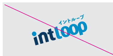
回転・傾斜しないでください