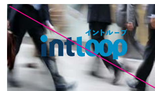
アクションの中心となる映像要素