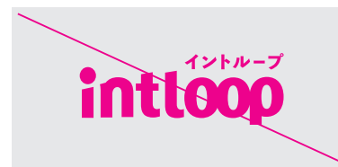
指定以外の色に変更しないでください