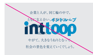
テキスト情報や字幕