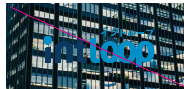
複雑な背景の上に配置しないでください