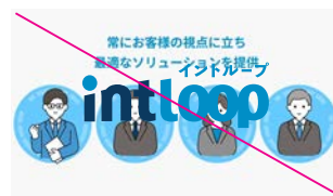
商品やサービスの重要な映像