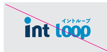
文字のサイズおよび文字間のスペースを変更しないでください