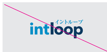
他の書体で表現しないでください