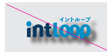
影や3Dなどの効果をかけないでください